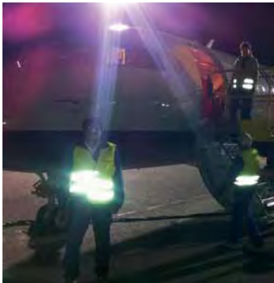
Lasting av fly