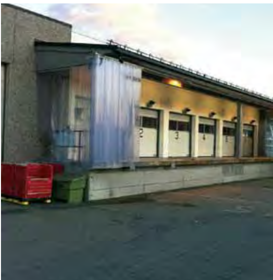
Porter for postmottak på flyplassen