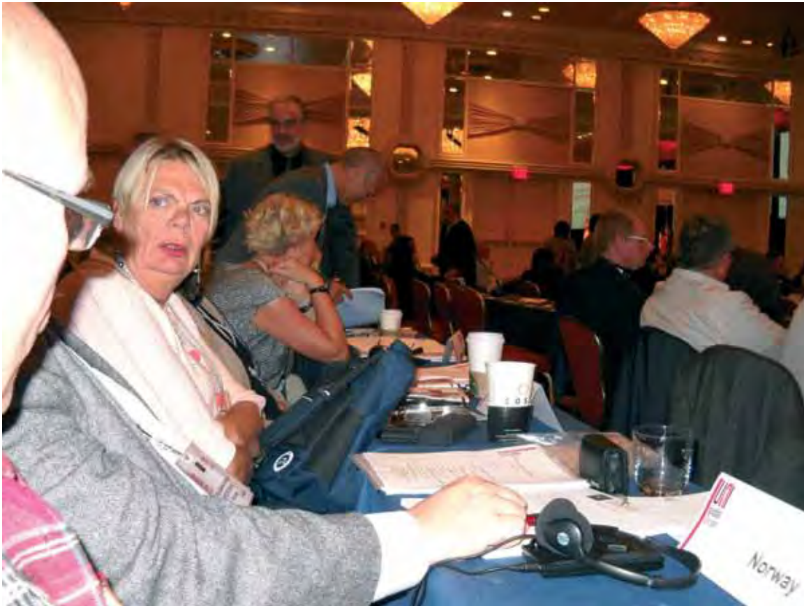
Delegasjonen fra Norge