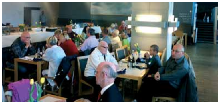
Servering av lunch etter toget.