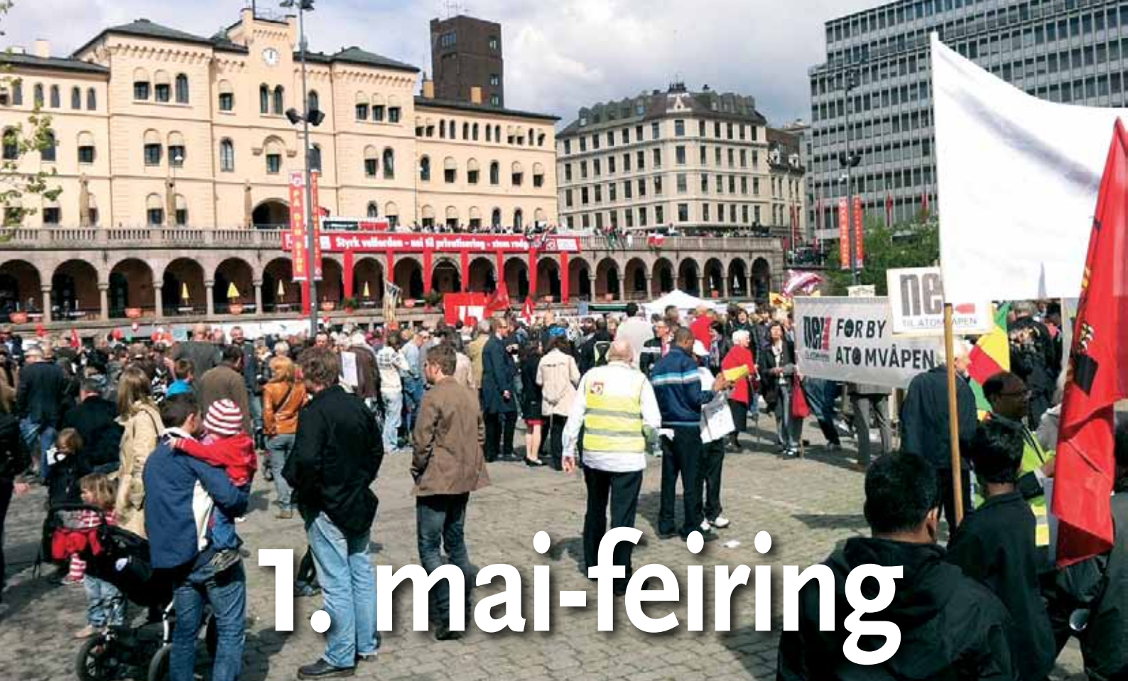
Oslo og Akershus krets på Youngstorget.

Det var lummert vær som møtte befolkningen på Arbeidernes dag.